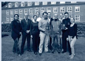
Spendenübergabe der Deutschen Hochschule der Polizei

Eine Spende in Höhe von 5.000 € erhielten wir von Studierenden der Deutschen Hochschule der Polizei in Münster. Traditionell übernehmen diese eine Spendenpatenschaft für unseren Verein.