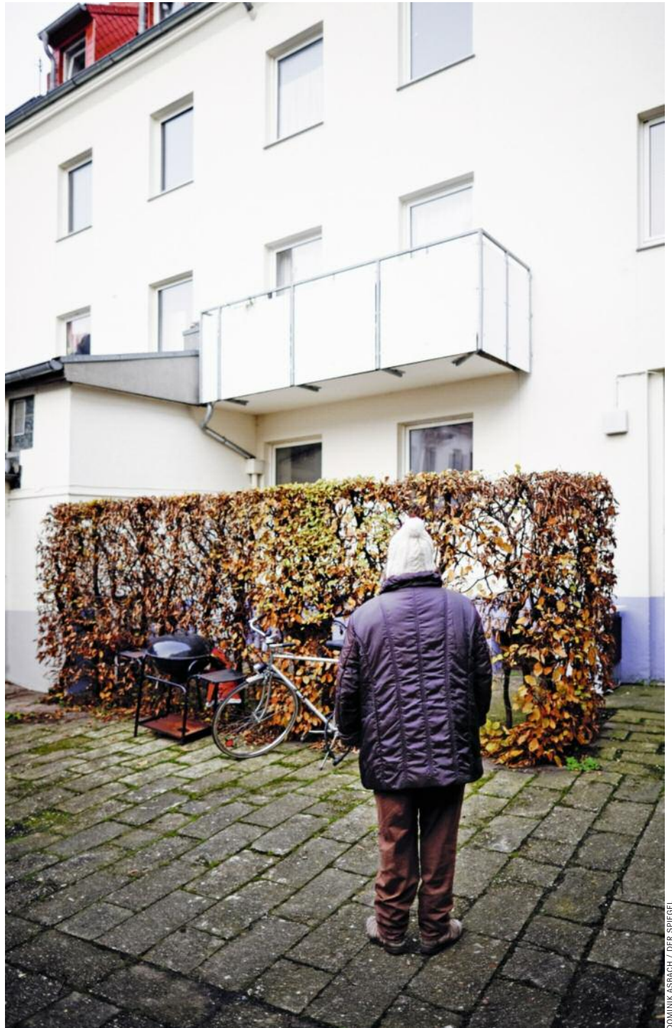
Missbrauchte Krüger vor Tatort in Münster: „Mir ist übel!“

K.s Treiben blieb lange folgenlos, auch weil der Zeitgeist auf seiner Seite war. Damals diskutierten Grüne und Liberale